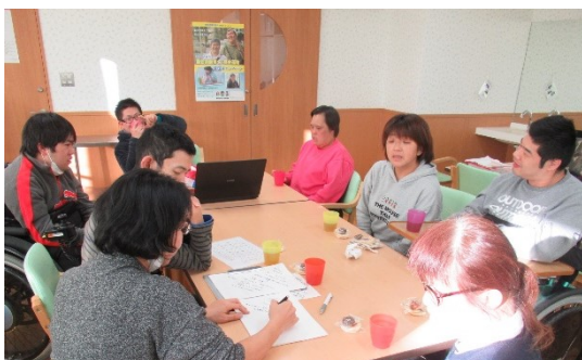
▲「どんな話になるのかな？」