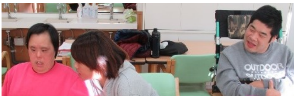
▲緊張しながらも、伝えてくれました。 となりで仲間の発言を優しく見守ります。