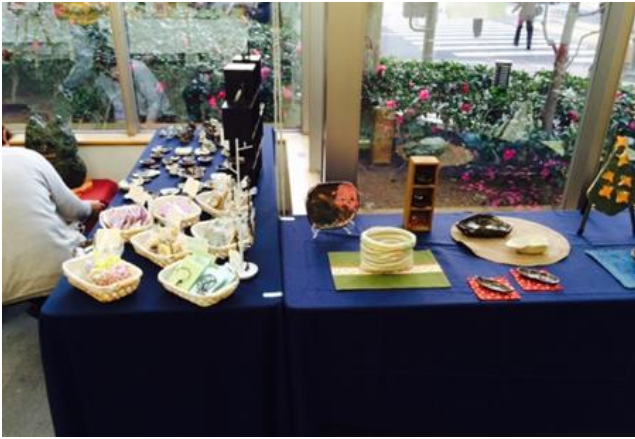
(上) 陶芸作品は迫力があります！

なかまの家は陶芸、絵画、さきおり、手芸などを中心に展示しました。また今回は初めての取り組みで、りんご班の絵画やポストカードなども展示することもできました。作品作りも普段から活動で取り組んでいる事もあり、絵画の描き方や、陶芸の色や形も毎年少しずつ変化が出てきて、一人ひとり自分の気持ちを表現している作品が増えてきているように感じました。