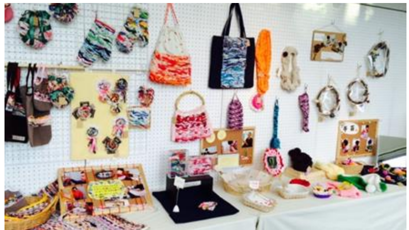
(上) さきおり・手芸も種類豊富です。