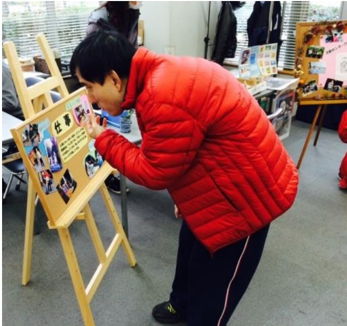
(上) 仕事の紹介も展示しました

一般の方たちもたくさん来場していただき、この場をお借りしましてお礼申し上げます。作品展は自分達が表現したものを地域にアピールする貴重な時間だと思っています。これからも色々なアイデアを出しながら続けていきたいです。