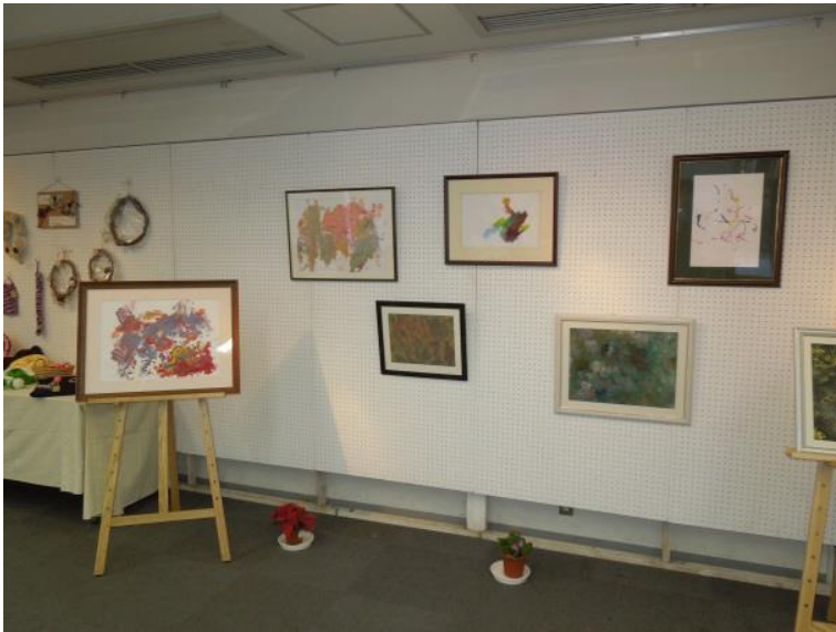
(下) 個性豊かな絵がたくさん

頑張って作ったものが作品として展示されており、自分の作品を見て嬉しそうの方もいれば、他の方の作品をじっくり見る方など、それぞれ作品展の雰囲気を感じていました。